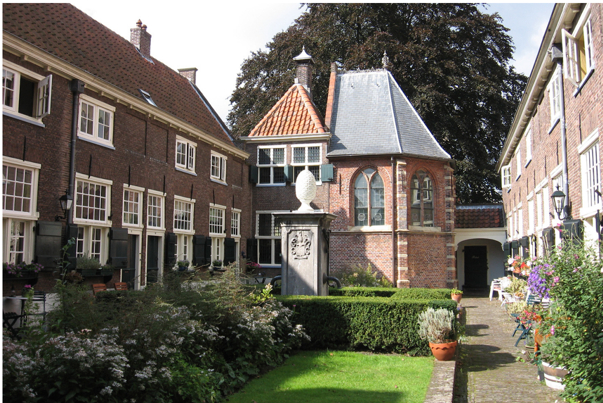
Een hofje in Leiden.

In de middeleeuwen werden ook hofjes gesticht. Dit zijn binnenplaatsen met kleine woningen eromheen waar ouderen mensen woonden. Het verschil met een gasthuis was dat binnen een hofje meer privacy was. Bewoners hadden een eigen voordeur. De stichter van een hofje legde vast welke regels er golden. Zo kan een regel zijn dat men elke vrijdag naar de kerk moest om te bidden. De woningen in een hofje waren niet voor de allerarmsten. Men moest geld betalen om er te komen wonen. Bij overlijden kwamen bezittingen en geld vaak toe aan het hofje. De bezittingen werden dan verkocht zodat het huisje opgeknapt kon worden voor de volgende bewoner.